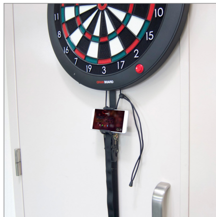
ダーツベルトへの取付例